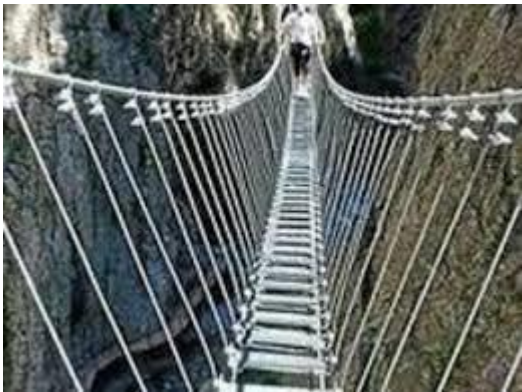
Ponte Tibetano Nuovo Percorso Wild