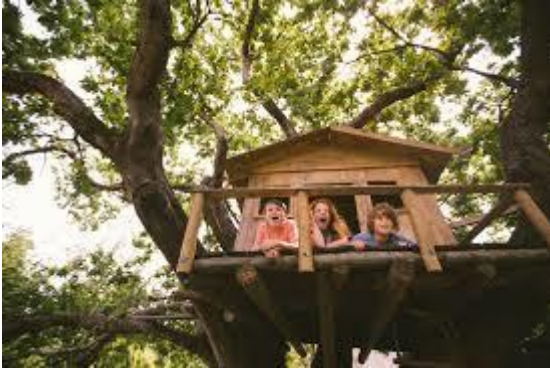
La casa di Tarzan