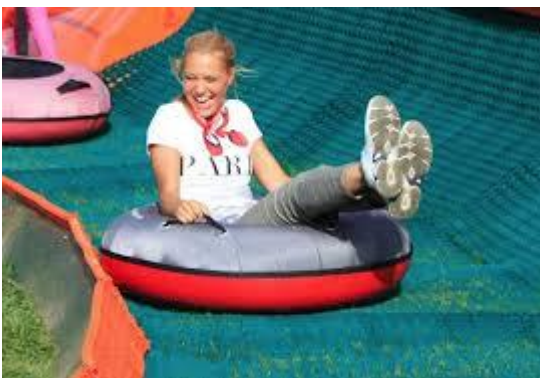
Ice Speed Adventure