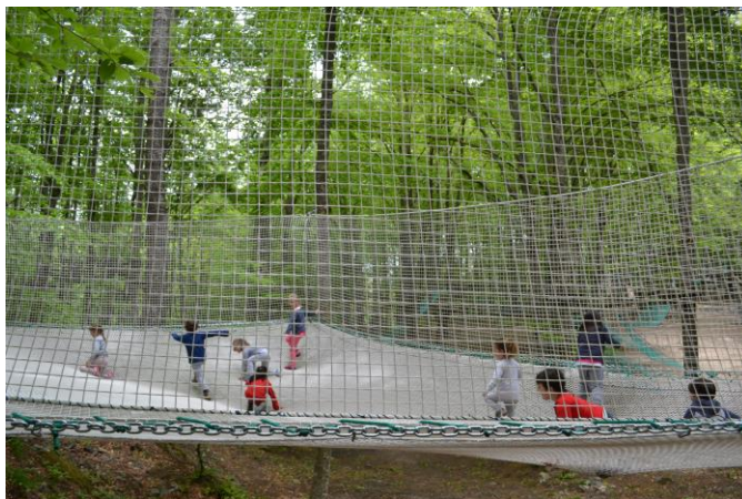
! Jump Tree Adventures!

E San Marino Adventures non è solo Parco Avventura ma anche Jungle Softair , per divertenti simulazioni di battaglia nel bosco con emozionanti sfide nel nostro campo gara ( ANCHE PER GRUPPI NUMEROSI ) che riproduce un villaggio da conquistare, in cui forniamo mimetiche, protezioni individuali e fucili da softair, oltre che l'arbitro e missione a scelta; Robin Hood Adventures , con divertentissima area di tiro con l'arco istintivo (da 7 anni in su); Il divertentissimo JUMP TREE ADVENTURES con mega rete statica sospesa tra gli alberi dove scatenarsi tra mille evoluzioni!